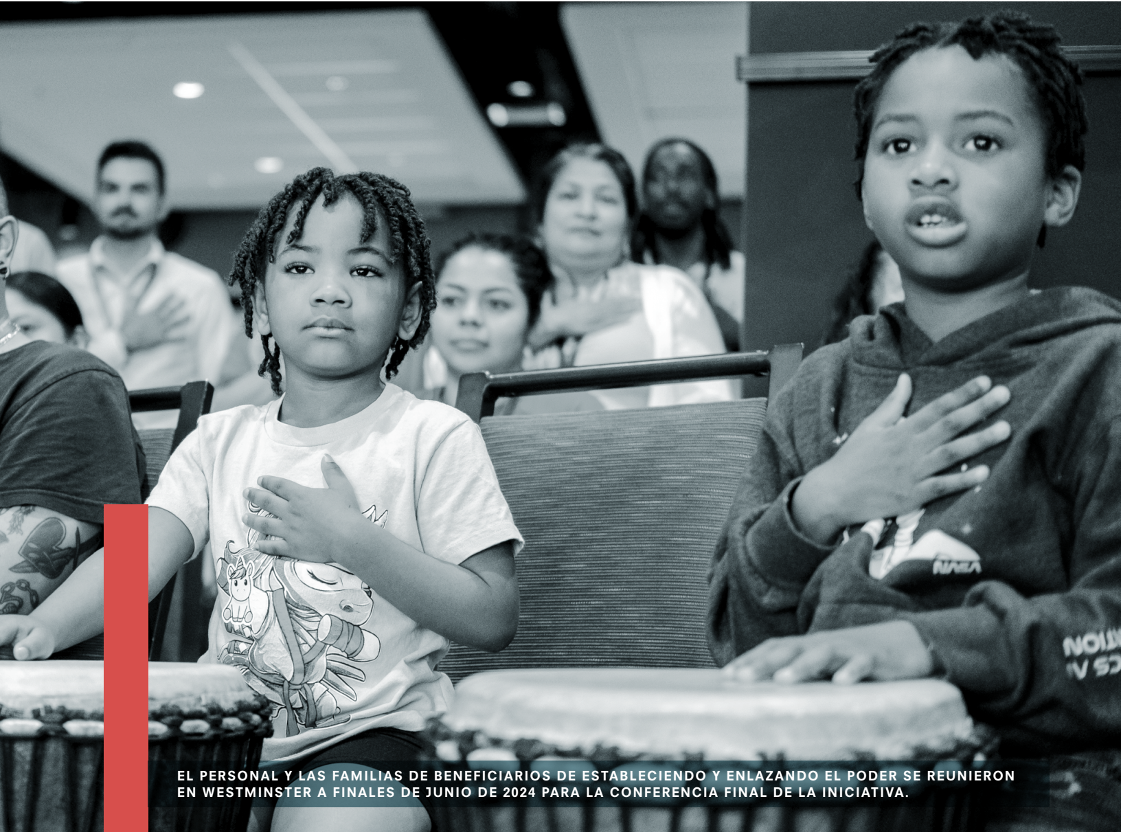
EL PERSONAL Y LAS FAMILIAS DE BENEFICIARIOS DE ESTABLECIENDO Y ENLAZANDO EL PODER SE REUNIERON EN WESTMINSTER A FINALES DE JUNIO DE 2024 PARA LA CONFERENCIA FINAL DE LA INICIATIVA.

para que numerosas organizaciones recibieran suscripciones de tres meses a la Guía de Subsidios de Colorado (en inglés).